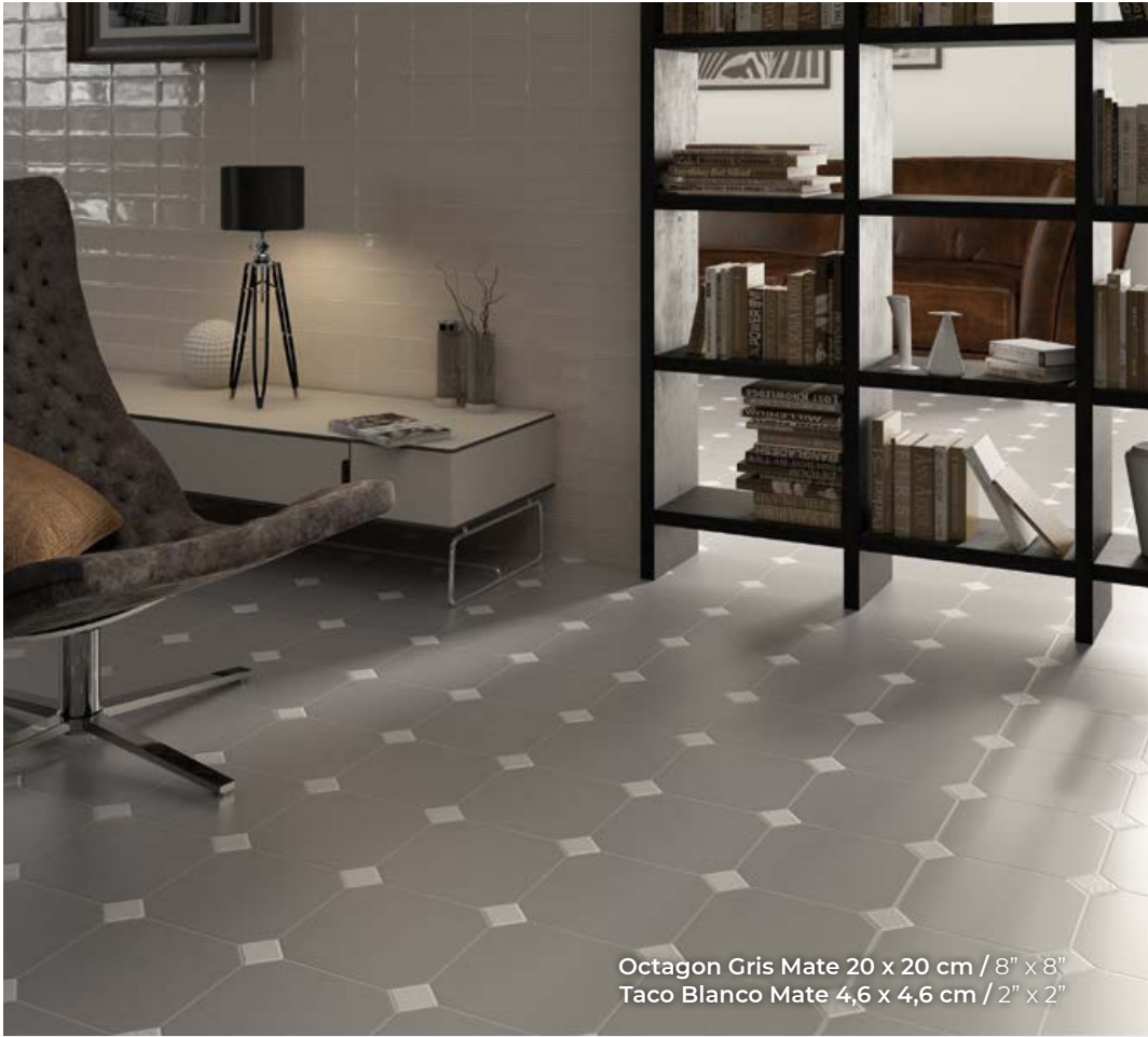
Octagon Gris Mate 20 x 20 cm / 8" x 8" Taco Blanco Mate 4,6 x 4,6 cm / 2" x 2"