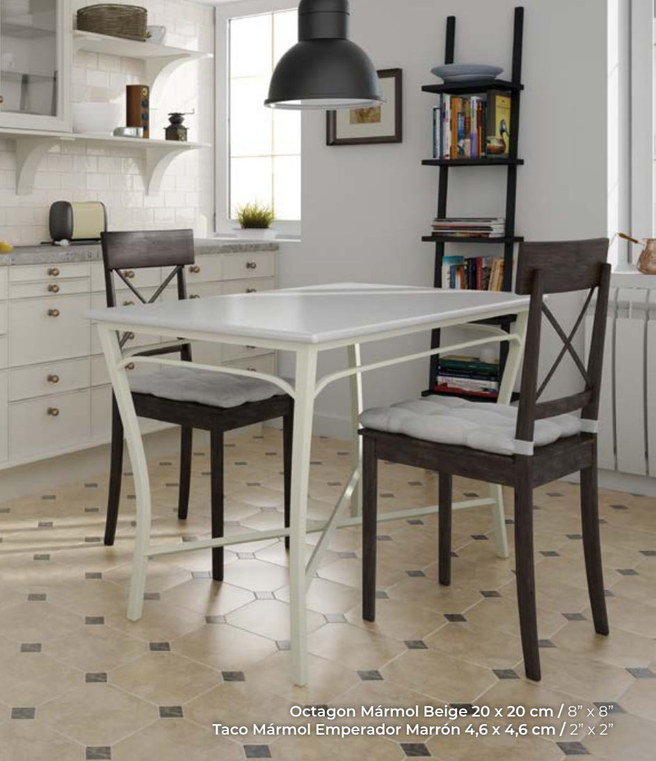
Octagon Mármol Beige 20 x 20 cm / 8" x 8" Taco Mármol Emperador Marrón 4,6 x 4,6 cm / 2" x 2"