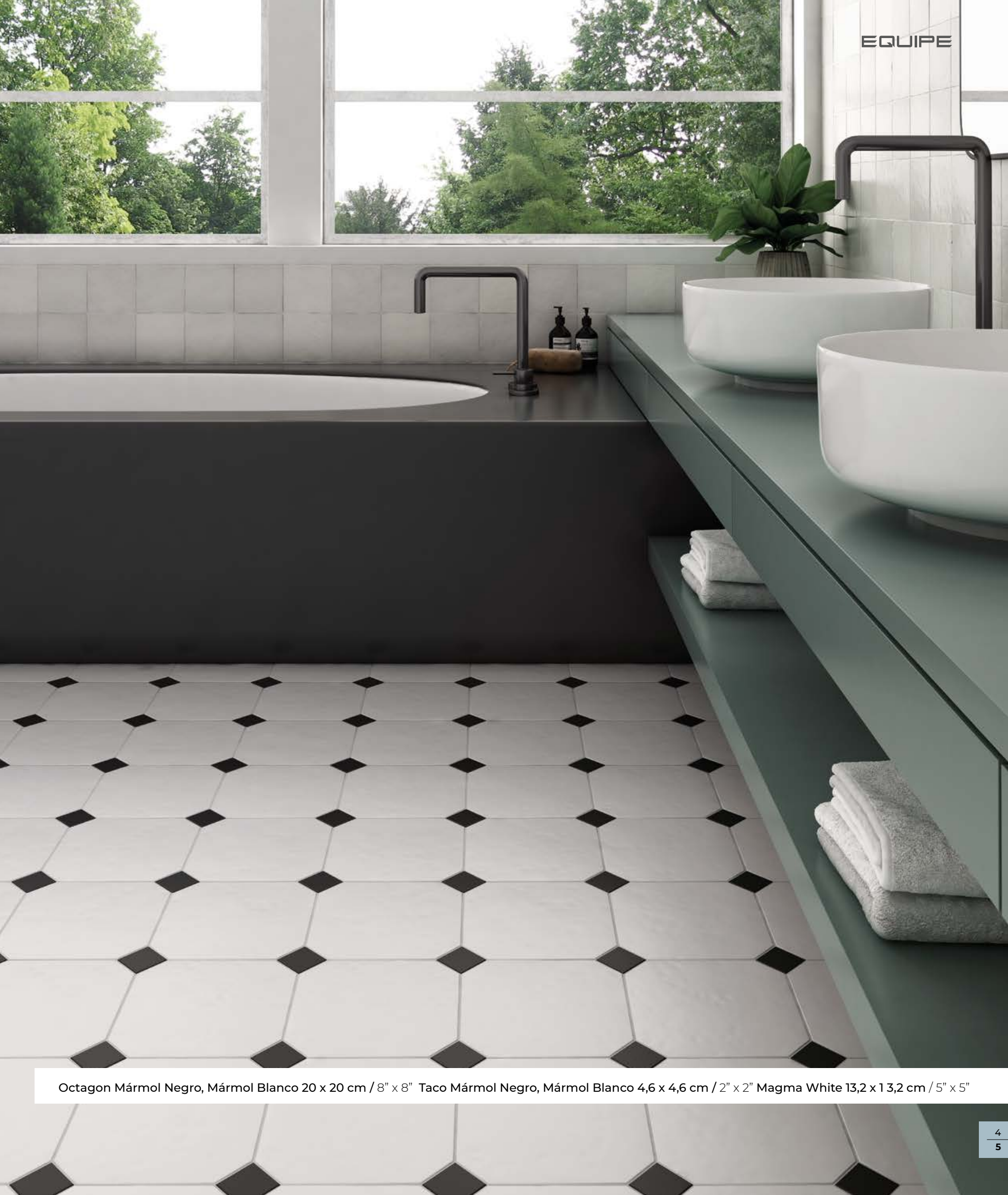
Octagon Mármol Negro, Mármol Blanco 20 x 20 cm / 8" x 8" Taco Mármol Negro, Mármol Blanco 4,6 x 4,6 cm / 2" x 2" Magma White 13,2 x 13,2 cm / 5" x 5"